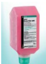
2000 ml dozirna plastenka

AQUA, SODIUM LAURETH SULFATE, SODIUM CHLORIDE, COCAMIDOPROPYL BETAINE, GLYCERYL RICINOLEATE, POTASSIUM COCOYL, HYDROLYZED COLLAGEN, SODIUM BENZOATE, GLYCOL DISTEARATE, POTASSIUM SORBATE, PARFUM, LAURETH-4, CITRIC ACID, PHENOXYETHANOL, METHYLPARABEN, ETHYLPARABEN, CI 73360