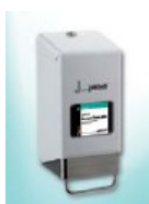
Visokokvalitetno kovinsko držalo